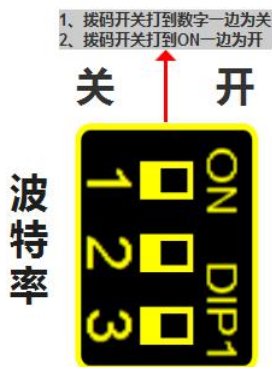
波特率拨码对应串口波特率对应表

RS485 接口的波特率由模块上的“波特率”拨码开关状态决定，注意当模块上电时调整拨码状态时，需将模块断电至少 3S，再上电方可生效。具体关系可见下表（出厂时所有拨码为 OFF）。